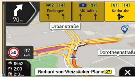
Die Navigation bietet sehr gute Routenführung inklusive Beschilderung