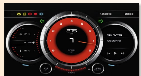
Die RealDash-App bietet ein virtuelles Armaturenbrett mit Echtzeit-Informationen