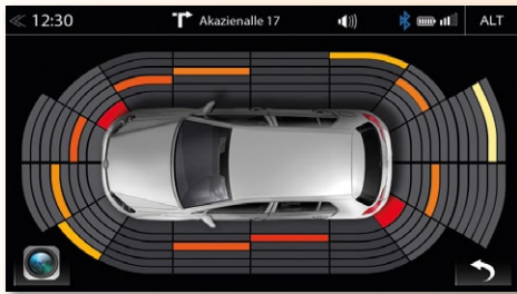
Darstellung des fahrzeugeigenen OPS