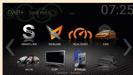
Smartphones können per SmartLink und Weblink gekoppelt werden