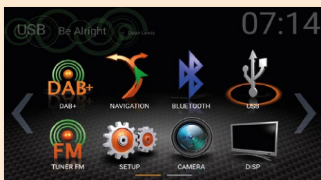
Übersichtliches Hauptmenü mit Direktzugriff auf wichtige Funktionen

Natürlich versteht sich das Core nicht nur mit der Fahrzeugelektronik, sondern auch mit Smartphones bestens. So spiegelt SmartLink Direct den Bildschirminhalt von Apple-iOS- und Android-Smartphones auf das Core-Display. Bei Android-Handys ist die App-Steuerung direkt über den Touchscreen des Core möglich, bei iPhones erfolgt die Bedienung via Smartphone. Die auf dem Core integrierte Weblink-2.0-Funktion bietet eine verbesserte Integration von interessanten Apps wie Youtube, ShoutCast oder Audio- und Video-Playern,